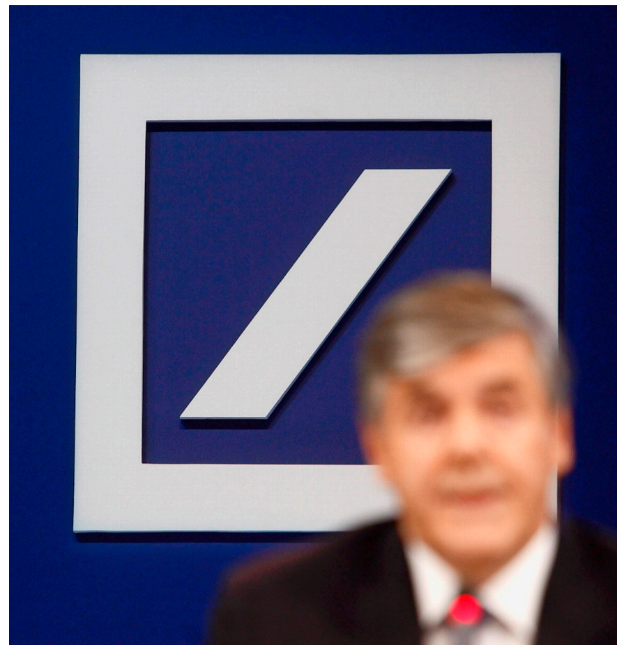
Josef Ackermann an seiner letzten Bilanzpressekonferenz.

Würde Glencore alle restlichen Xstrata-Aktien zum aktuellen Marktpreis kaufen, müsste der Konzern mehr als 25 Milliarden Euro hinlegen. Es wäre damit die grösste Transaktion in der Branche, seit Rio Tinto den Aluminiumproduzenten Alcan im Jahr 2007 kaufte. An der Börse war die Reaktion positiv: Die in der Schweiz und Grossbritannien kotierten Xstrata-Aktien legten um fast elf Prozent zu. Die Glencore-Titel stiegen derweil um über sechs Prozent. (Reuters)